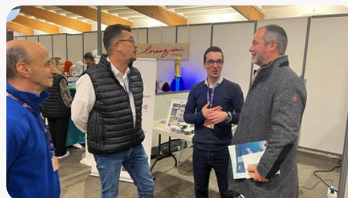
Inauguration du Salon Innov'action, le 15 décembre