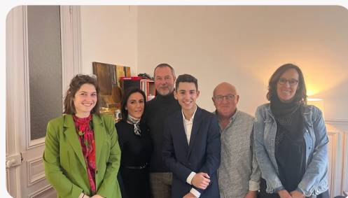
Moment de convivialité avec mon équipe parlementaire, le 14 décembre