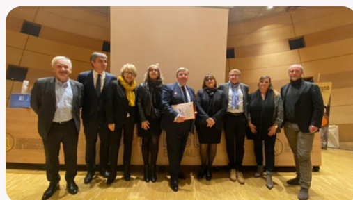
Réunion "Commission territoriale" avec le CD88, le 11 décembre 2023